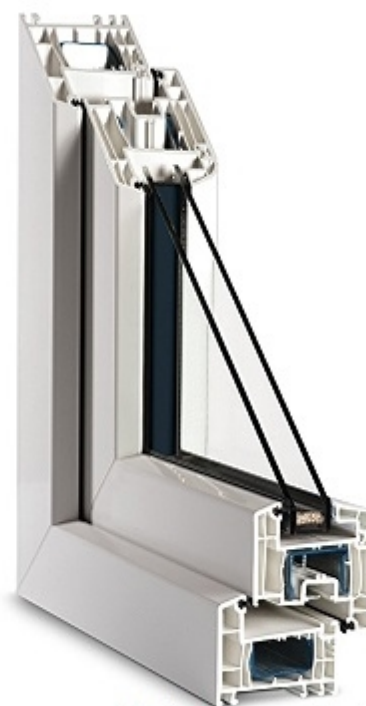
Obrázek je pouze ilustrativní.

Jak nejvíce ušetřit s novými okny? Porovnejte si parametry oken na zadní straně této nabídky.