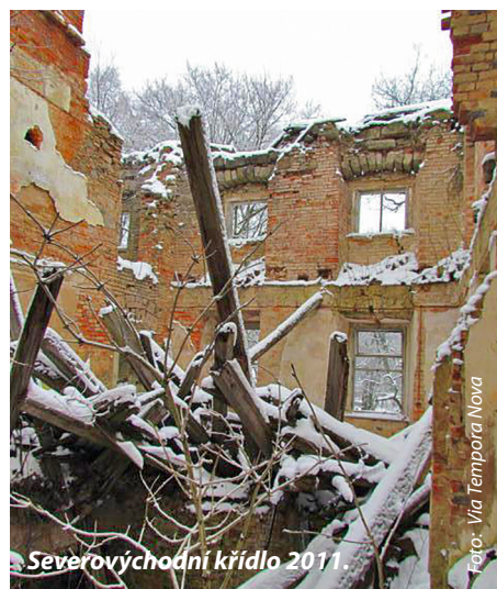
Severovýchodní křídlo 2011.

Tento unikátní zámek byl odsouzen k zániku, unikl demolicí jen o vlásek. Nynější vlastník spo-