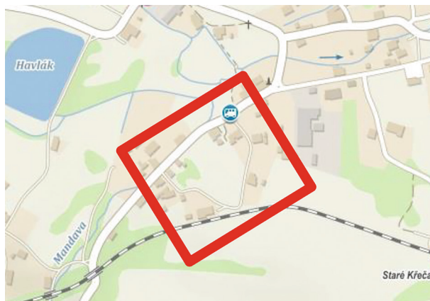
Plánovaná oprava u zastávky ELITE.