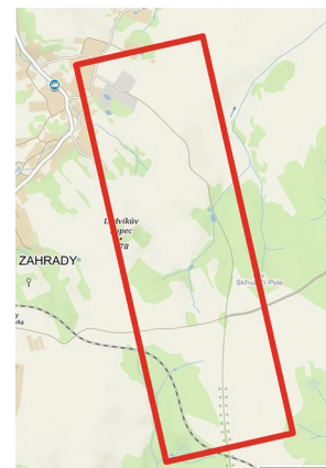
Tato komunikace se bude letos realizovat.