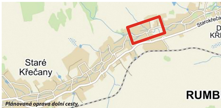
Plánovaná oprava dolní cesty.