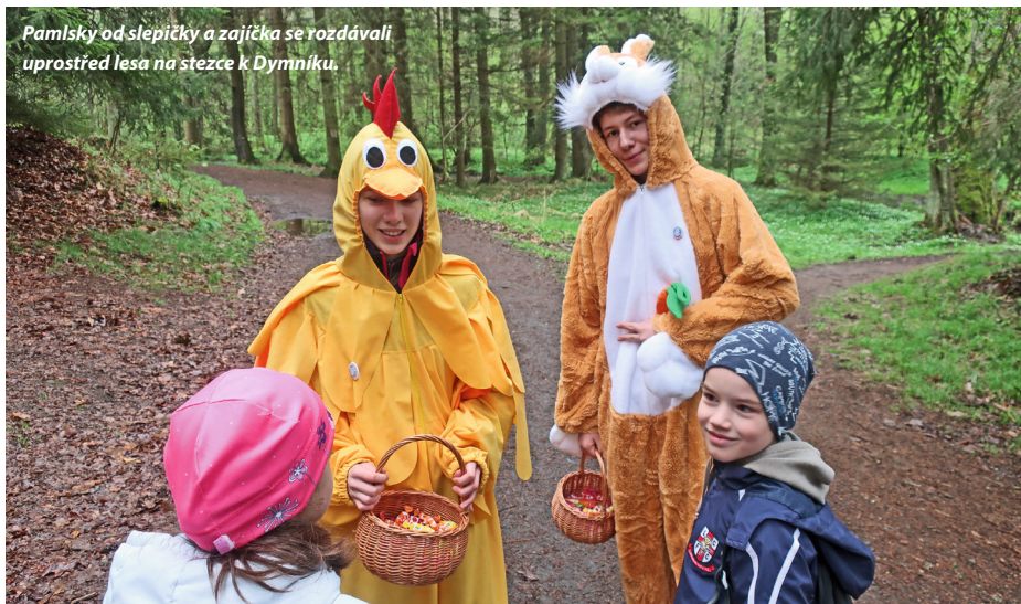
Pamlsky od slepičky a zajíčka se rozdávali uprostřed lesa na stezce k Dymníku.

Na rozhledně bylo živo. Příležitost rozhlédnout se z vyhlídkové věže využil téměř každý. Vždyť je to jeden z významných symbolů