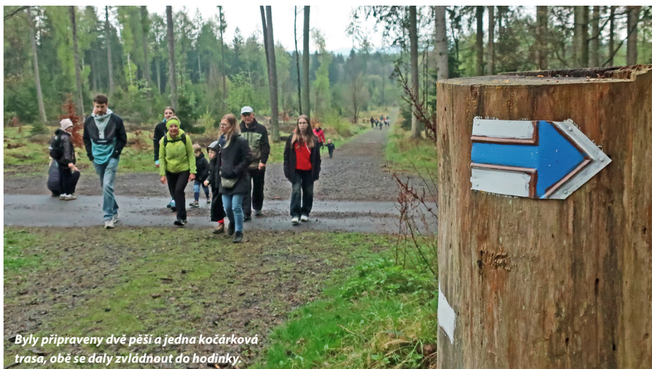
Byly připraveny dvě pěší a jedna kočárková trasa, obě se daly zvládnout do hodinky.