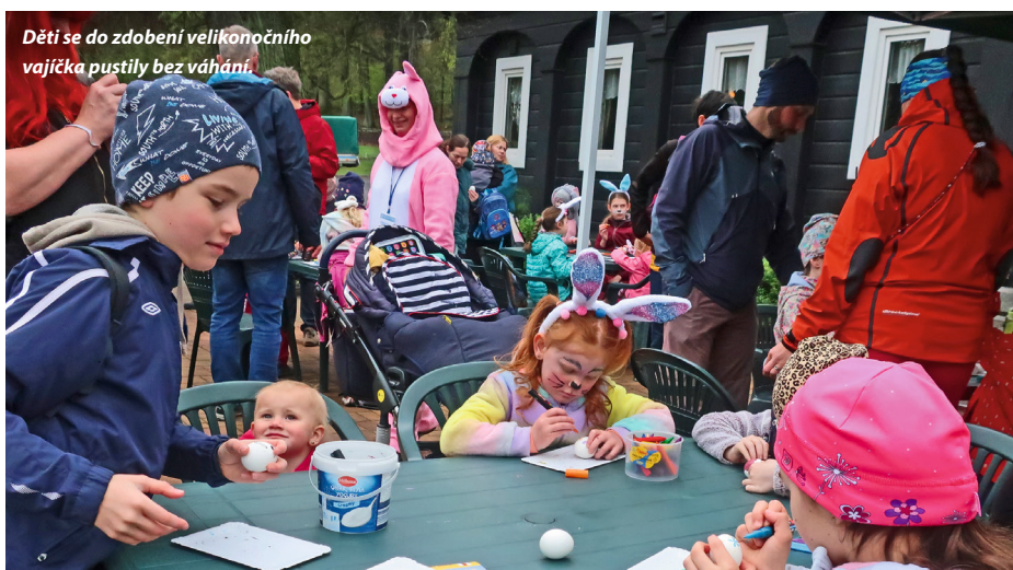
Děti se do zdobení velikonočního vajíčka pustily bez váhání.

města Rumburku, a není náhodou, že o ni pečuje právě Klub českých turistů. Hlavní program se však odehrával u restaurace Dymník pod rozhlednou. Každý, kdo dorazil