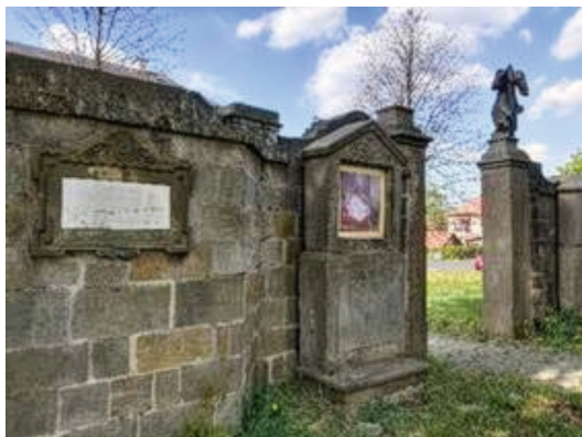
Křížová cesta Staré Křečany