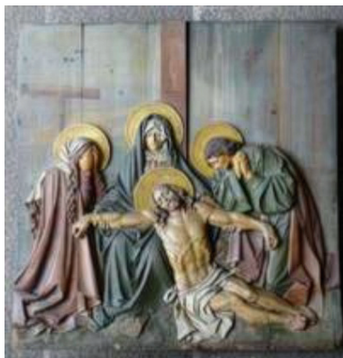
Původní dřevěný reliéf: foto Ester Sadivové

Snad každá obec by se chtěla pyšnit svoji vlastní křížovou cestou. Proto v rámci české krajiny najdeme okolo 152 venkovních křížových cest. Jen v našem Šluknovském výběžku jich nalezneme 14, což svým počtem tvoří ojedinělý fenomén. A pokud je navštívíte, zjistíte, že každá z cest je jiná a každá jinak krásná. Putování po křížových cestách našeho regionu nabízí inspirující duchovní zážitky a možnost propojit se s generacemi lidí, jež se s vroucí modlitbou před každým z výjevů s pokorou zastavovaly.