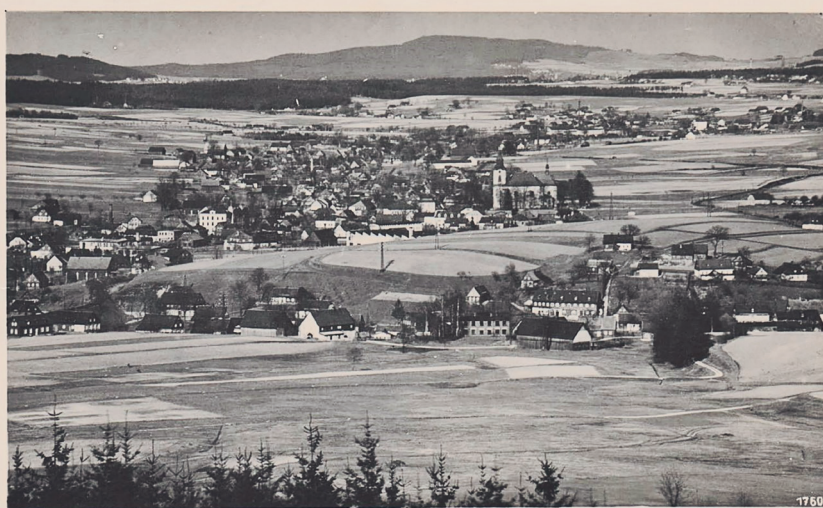
Alt-Ehnenberg bei Rumburg, Sudetenland